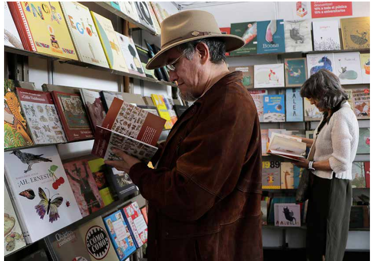
Con gran participación se realizó la Feria del Libro y la Rosa en el Centro Cultural Universitario.