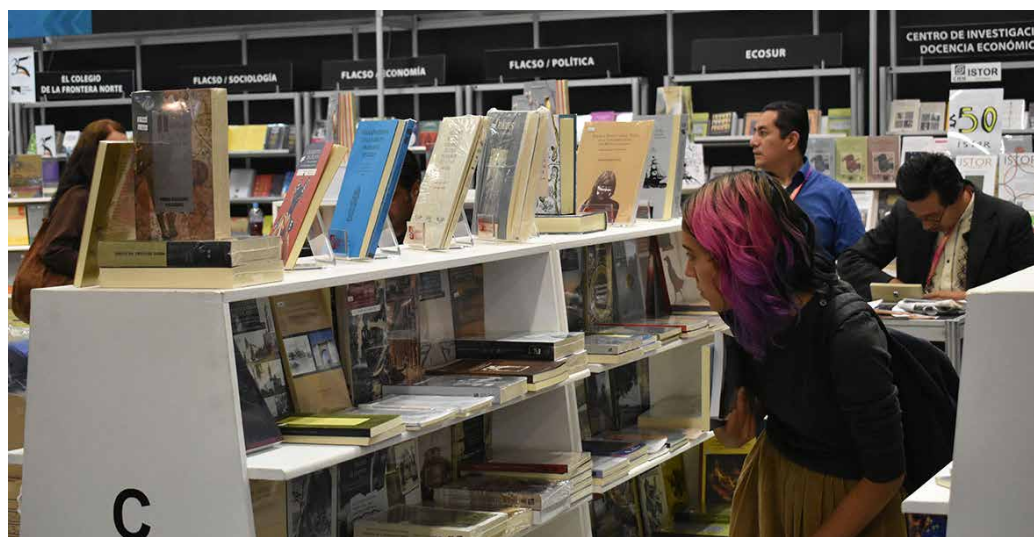
Librerías, una tarea pendiente. A nivel nacional el promedio es una librería por cada 43 760 habitantes.

dedicadas a la lectura, los autores y los lectores, donde el libro es el personaje principal de cada uno de ellos. El Día Internacional del Libro es una conmemoración celebrada a nivel mundial en más de cien países al día de hoy, que tiene como objetivo fomentar la lectura, la industria editorial y la protección de la propiedad intelectual por medio del derecho de autor, por lo que se decidió rendir un homenaje universal a los libros y autores en esta fecha, alentando a todos los ciudadanos, y en particular a los jóvenes, para que descubrieran el placer de la lectura y a valorar las irremplazables contribuciones de aquellos quienes han impulsado el progreso social y cultural de la humanidad.