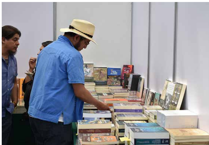
Debemos reconocer al libro como depositario de un gran valor cultural.

SIN TASA CERO. De acuerdo con las cifras del Instituto Nacional de Estadística y Geografía (INEGI) existen 2, 740 comercios de venta al por menor del libro, de éstos Zacatecas cuenta con una librería por cada 82 mil habitantes, la Ciudad de México tiene una por cada 16 mil y a nivel nacional el promedio es una librería por cada 43, 760 habitantes.