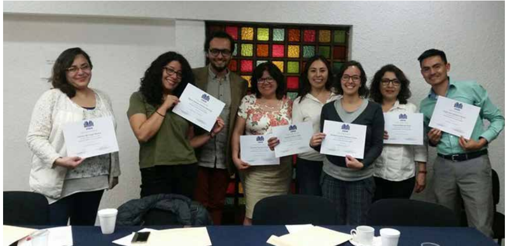
Grupo de participantes del curso-taller.

Durante ocho horas los participantes, provenientes de Ediciones SM, Universidad Nacional