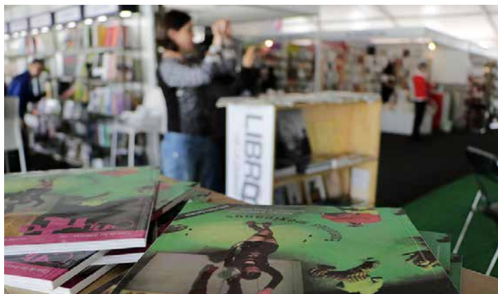
Talleres, teatro, charlas, seminarios, conciertos, homenajes, conferencias y proyecciones de cine, entre las actividades que se realizaron.

La celebración reunió a escritores, artistas e intelectuales que abordaron diversas temáticas, entre las que destacan los ejes programáticos mencionados