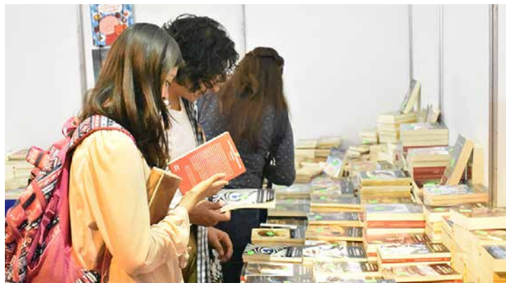
En México se producen cerca de 26 mil títulos al año, de los cuales cinco mil son novedades.

“Sobre la México, creo que mantiene la atención de estudiantes que van a hacer tarea; no la veo con una gran actividad cultural, y aunque resguarda los acervos de las bibliotecas Antonio Castro Leal, Jaime García Terrés, Alí Chumacero y Carlos Monsiváis, me parece más de museo que de consulta. Esas bibliotecas debieron ubicarse de otra manera. Por ejemplo, la de Monsiváis yo la habría dejado en la colonia Portales para hacer la Biblioteca de la Crónica, pero es una idea personal”.